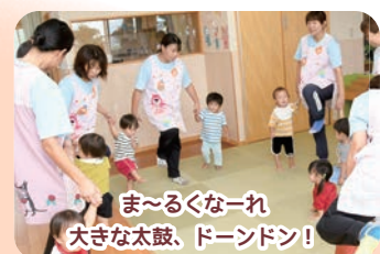
ま〜るくなーれ 大きな太鼓、ドーンドン!