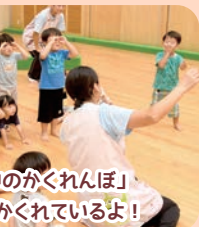
のかくれんぼ かかっているよ!