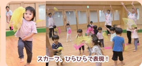
スカーフ、ひらひらで表現!