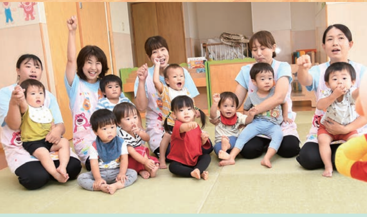
※あつみ幼稚園では、リズムの専門教育を学び指導のノウハウを身につけた職員が指導に当たっています。