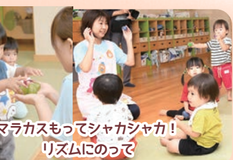
マスカラもってシャカシャカ! リズムのって